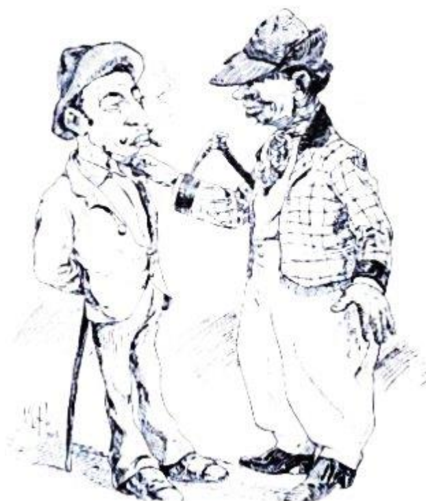
Figura 2 – “Typos e uniformes dos antigos Nagoas e Guaiamus”

Fonte: Revista Kosmos , 1906. Ilustrador Kalixto. Disponível em: < http://www.capeira-palmares.fr >.